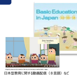
日本型教育に関する動画配信（8言語）など