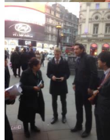
サービス産業ミッション