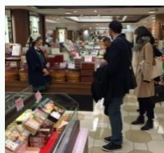
パートナー候補 招へい事業