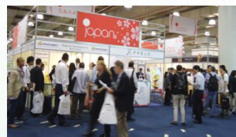
インターナショナル・ フランチャイズ・エキスポ