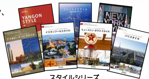
スタイルシリーズ