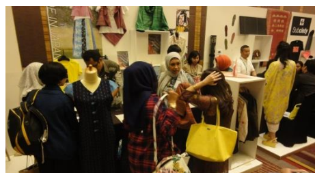
テストマーケティング